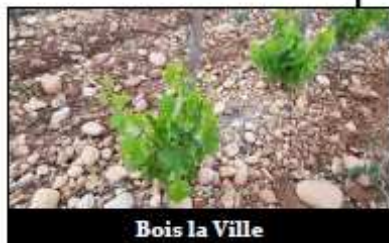
Bois la Ville