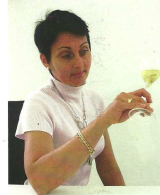
« Ce petit rendement garantit une palette aromatique importante et un long potentiel de vieillissement, précieuse telle, d'autant que je travaille avec du jeune bois ».

face à son domicile. Tout est neuf dans ce bâtiment industriel, climatisé et éclairé par des lampes au sodium : balance, presse PIRA de 4000 kg, cuves en inox réfrigérées, tonneaux en bois, mais aussi bureau, cuisine. Cette jeune femme volontaire ne laisse rien au hasard et met tout en œuvre pour réussir à élaborer des champagnes gourmands. En 2011, elle présente quatre cuvées : un Brut nature 100 % Pinot Noir de l'année, non dosé, à la fois vireux et fruité ; un Brut classique avec 30 % de Chardonnay, 50 % de Pinot Noir et 20 % de vins de réserve ; et une nouveauté 2011, un rosé de saignée avec du Meunier de vieilles vignes, dont elle fait macérer les grappes pour obtenir une attrayante teinte pétale de rose, qu'elle baptise « Tentation Rosée » ; et enfin Val Cornet, issue du terroir du même nom, sa cuvée préférée. Ce mono-cru est planté en Pinot Noir et Pinot Meunier vieilles vignes ne produisant pas plus de 6.000 kg l'hectare.